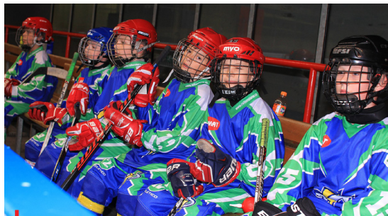
Dodržování nového etického kodexu bude závazné pro všechny sportovní svazy

V gesci Národní sportovní agentury je vznik platformy bezpečného sportu a zavedení nových rolí - „ombudsosoby“ na národní úrovni a tzv. ochránců (safeguard officers) v jednotlivých svazech. Na ně se budou moci obracet ti, kdo zažijí špatné zacházení nebo budou jeho svědky. Jejich úkolem bude prošetření podnětů i sdílení dobré praxe. NSA také předloží do konce roku věcný návrh zákona o sportu, v němž bude část věnovaná opatřením proti negativním jevům.