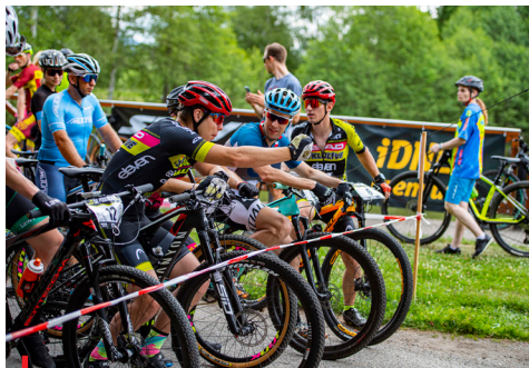
Český sport potřebuje od státu víc prostředků