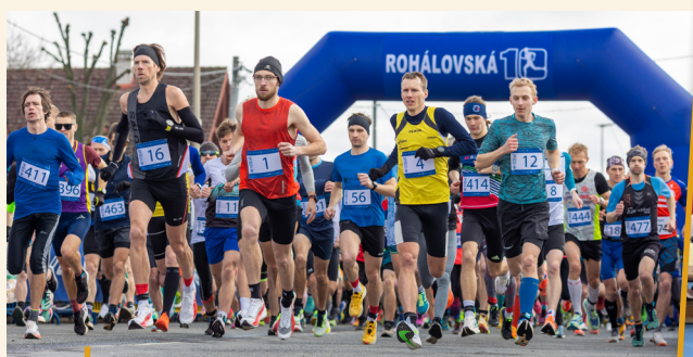
Na trat' Rohálovské desítky v Prusinovicích vyrazilo 550 vytrvalců - do cíle jich doběhlo 505.