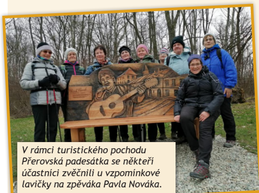
V rámci turistického pochodu Přerovská padesátka se někteří účastníci zvěčnili u vzpomínkové lavičky na zpěváka Pavla Nováka.