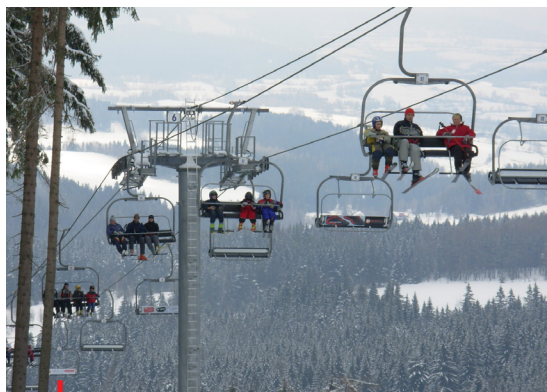
Zimní sezona v Lyžařském areálu Zadov skončila letos velice brzy

V dalším průběhu schůze VV ČUS schválil pověření zástupce ČUS k výkonu akcionářských práv na valné hromadě společnosti Sportovní areál Ha-