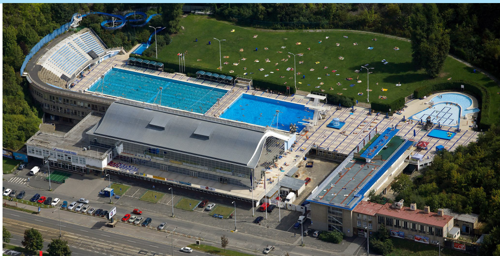
ČEZ Plavecký stadion v Praze-Podolí

Příhláška je společná pro oba typy pojištění (odpovědnost i majetek), nicméně lze zvolit a přihlášku vyplnit pouze pro jeden druh pojištění. Odesláni přihlášky neznamená automatické uzavření smlouvy. Jedná se pouze o poptávku, tedy vyjádření zájmu tělovýchovné jednoty nebo sportovního klubu. Lze ji zaslat do RENOMIA poštou (Na Florenci 15, 110 00 Praha) či na níže uvedený email. Příhláška je závazná až po podpisu zástupcem TJ/SK. Pojištění lze sjednat s počátkem pojištění vždy od 1. dne následujícího měsíce po zaslání podepsané přihlášky do RENOMIA.