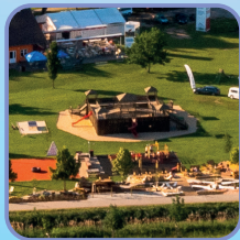
Dětská hřiště a zábavné prvky