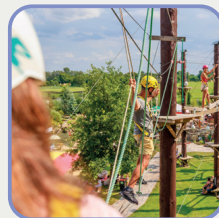
Herní prvky pro volný čas a zábavu