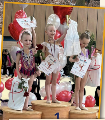
Již 33. ročník Milevského poháru v moderní gymnastice byl opět jedinečnou přehlídkou nejmladších talentů z České republiky i zahraničí.