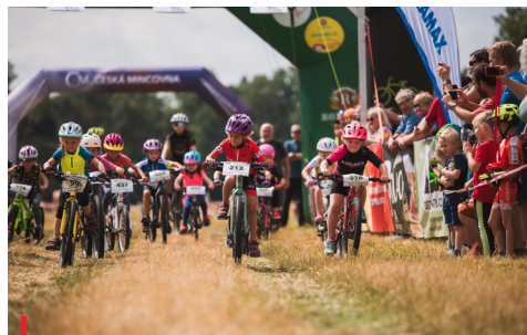
Pravidelnými průzkumy ve sportovních klubech získává ČUS důležité údaje o jejich činnosti i problémech