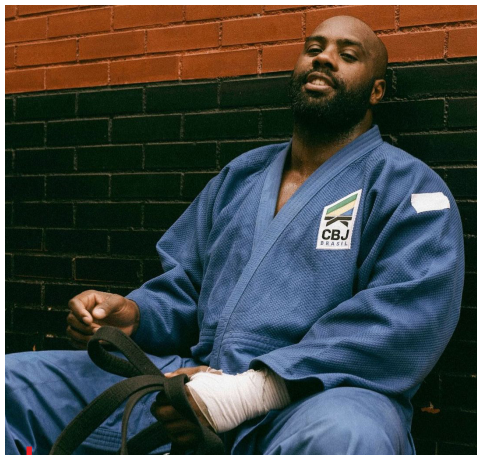
Francouz Teddy Riner patří k velkým hvězdám světového sportu. V judu pak je absolutní legendou historie tohoto odvětví.

Kempu v Nymburku, který skončil v pondělí, se účastnilo zhruba 600 judistů a judistek včetně