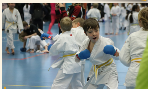
Velkému zájmu se těšil Kamiwaza Cup v Praze - turnajem pro děti, které začínají s bojovým uměním karate nebo mají zatím jen minimální zkušenosti.