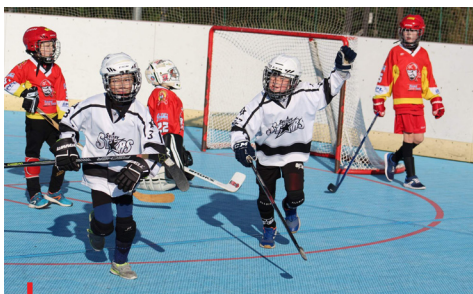
Děti by měly sportovat hodinu denně.

Zdroj: Nadační fond Aktivní ČESKO Foto: Tipsport Sportuj s námi