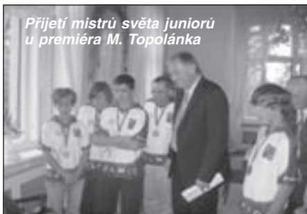
Přijetí mistrů světa juniorů u premiéra M. Topolánka

CIPS. Souběžně se uskutečnilo i setkání představitelů a zástupců sportovních a rekreačních rybářů země EU. Tyto akce předcházely květnovému konání světového XXVII. Kongresu CIPS (Confédération Internationale de la Pêche Sportive) v Praze. Tato organizace sdružuje ve svých čtyřech mezinárodních federacích 108 národních sportovních federací z 54 států světa, které reprezentují aktivity více než 60 milionů sportovních rybářů. Kongres byl pro svaz nejvýznamnější událostí za uplynulých několik desítek let.