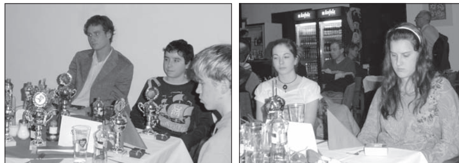
Z vyhlášení nejlepších sportovců okresu Bruntál za rok 2007

„Je třeba hledat nové formy a možnosti jak pomáhat klubům především na vesnici. Vyvolaly