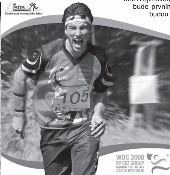
SOB Český svaz orientačního běhu