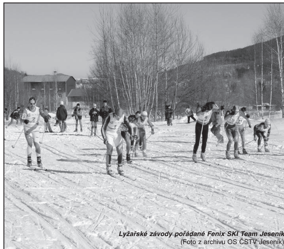
Lyžařské závody pořádané Fenix SKI Team Jeseník

ZPRAVODAJ ČSTV a Nakladatelství OLYMPIA, a. s.