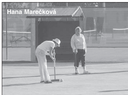
ketu. Sdružuje 64 členů v pěti klubech a pořádá na území ČR každoroční MČR a dalších cca 15 turnajů.

AČMK se věnuje výhradně asociacnímu kro-