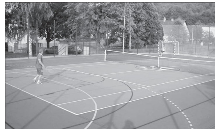
Víceúčelové hřiště v České Vsi