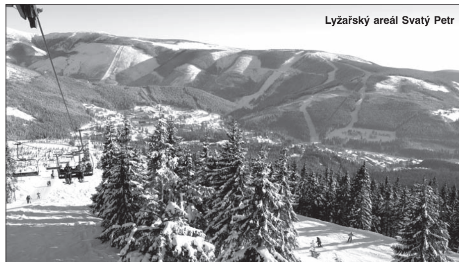
Lyžařský areál Svatý Petr

Od letošního roku mohou lyžaři navíc využít možnost získávat aktuální informace ze Skiareálu Špindlerův Mlýn přímo do svého e-mailu. Stačí se zaregistrovat na http://www.skiareal.cz/