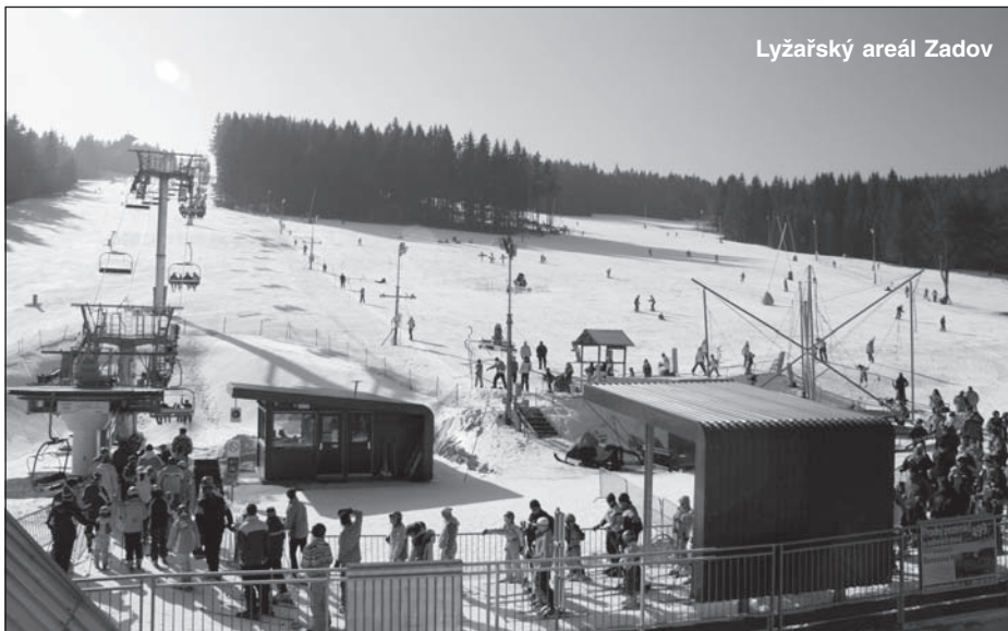
Lyžařský areál Zadov

Tak jako v dřívějších letech, tak i v letošní sezóně budeme provozovat skibusy. Nejen již tradiční a oblíbené z Písku a Č. Budějovic na večerní lyžování, ale i skibus z Vimperka přes Stachy na denní lyžování. Ten bude během dne plnit i funkci kyvadlové dopravy. Po naplnění parkoviště na Kobyle bude přepravovat lyžaře z dolního parkoviště a tím dojde ke zlepšení dopravní situace na Zadově v exponovaných termínech prázdnin a víkendů. Jízdní řady a více informací o dění v areálu Zadov najdete na internetových stránkách www.lazadov.cz .