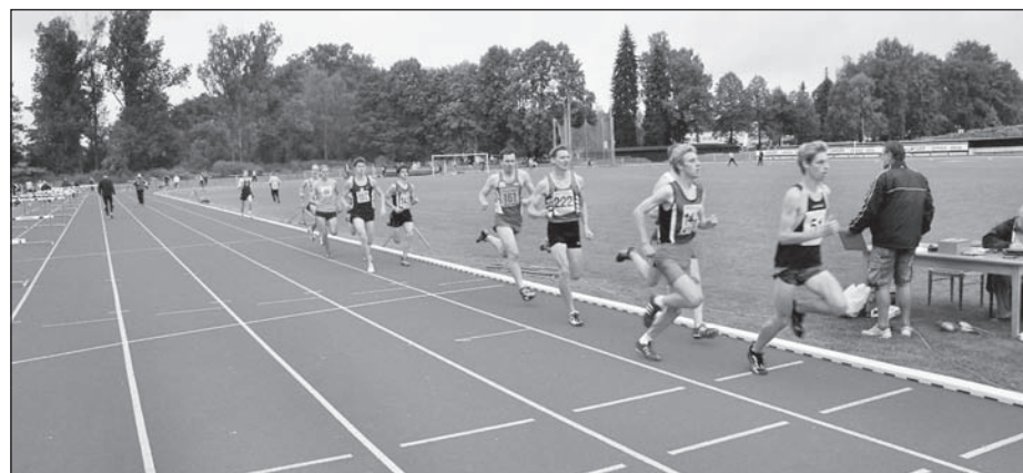
Foto: Nahoře atletický stadion Jiskry Ústí nad Orlicí; dole vyhlášení nejlepších sportovců okresu