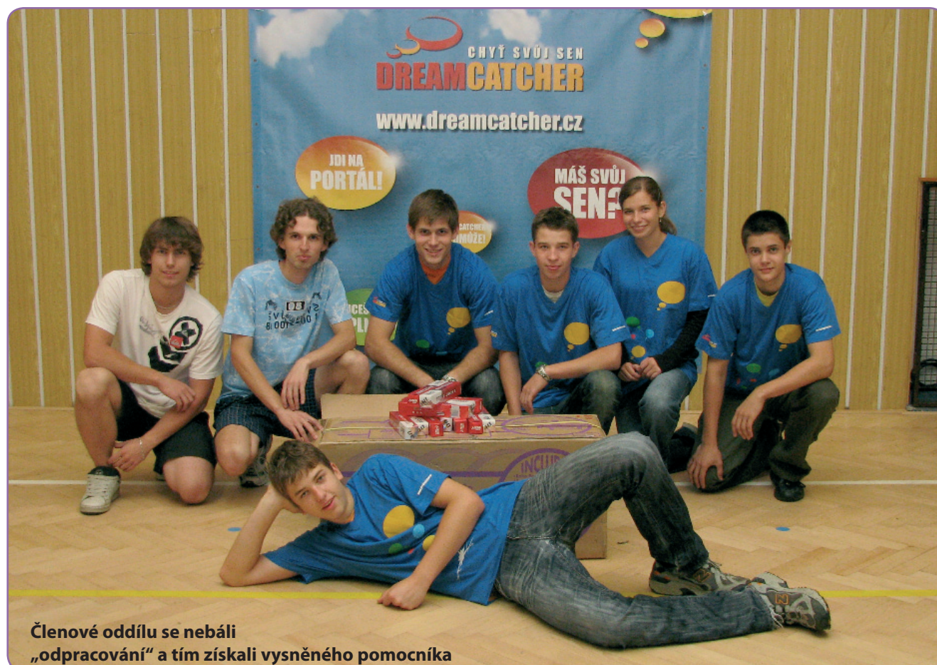
Členové oddílu se nebáli „odpracování“ a tým získali vysněného pomocníka