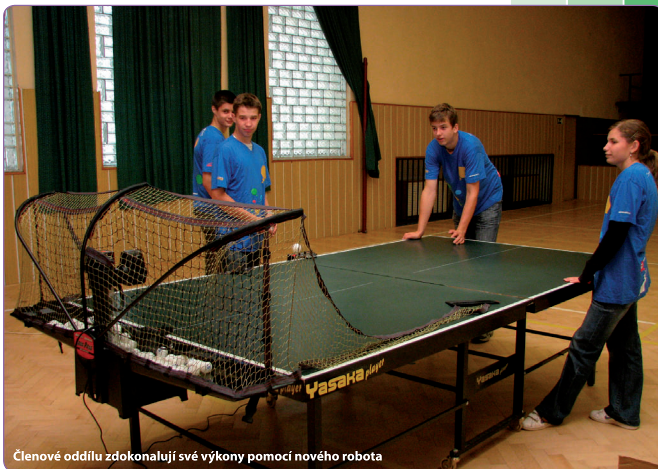
Členové oddílu zdokonalují své výkony pomocí nového robota

► Už 12 týmů si svůj sen splnilo! Mimo jiné i začínající kapela Escape the Deer z Prahy, která si přála bicí. Ze sportovců se štěstí usmálo na oddíl stolního tenisu z Dlouhomilova.