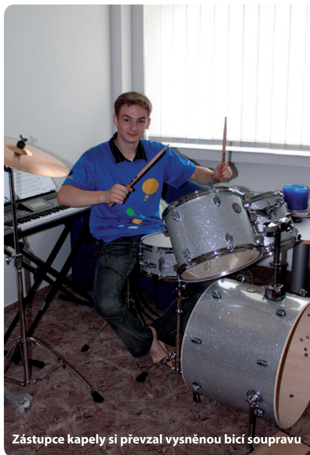
Zástupce kapely si převzal vysněnou bicí soupravu

Z podkladů organizátora akce zpracoval David Opatrný