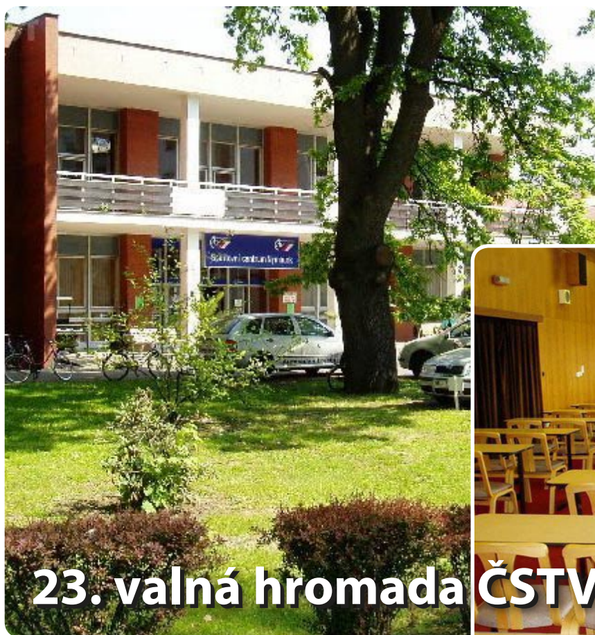
23. valná hromada ČSTV