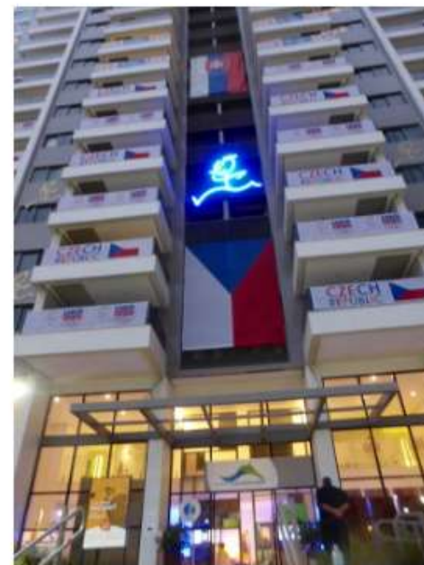
Zatopek likeness lit up at the Czech residence

Written by Brian Pinelli in Rio de Janeiro