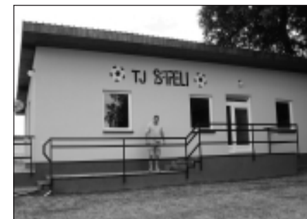
Nově vystavěné kabiny pro fotbalisty TJ Sapeli Janovice