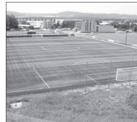
Hřiště s umělou trávou STARZ Strakonice

„Co se týká financování a jeho dopadu do TJ/SK a svazů, chápu nevykrytí dotace roku 2006 jako velký problém. TJ/SK sice berou dotaci z vlastních zdrojů vzhledem k výši svých nákladů jako příspěvek, ale jsou to finanční prostředky, se kterými ve svých rozpočtech počítaly.“