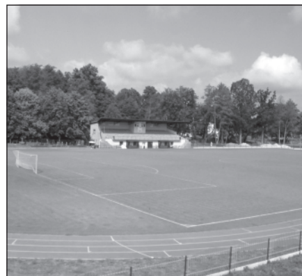
Stadion TJ Blatná