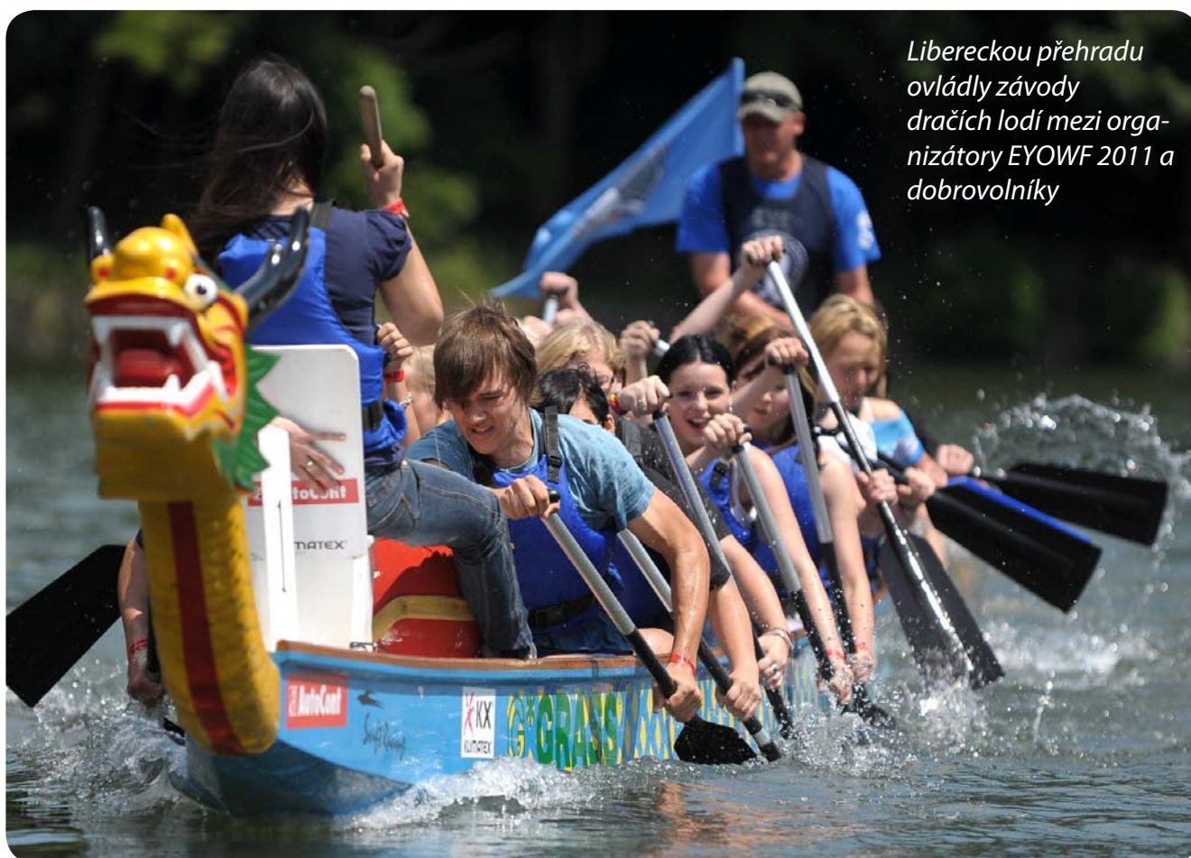
Libereckou přehradu ovládly závody dračích lodí mezi organizátory EYOWF 2011 a dobrovolníky